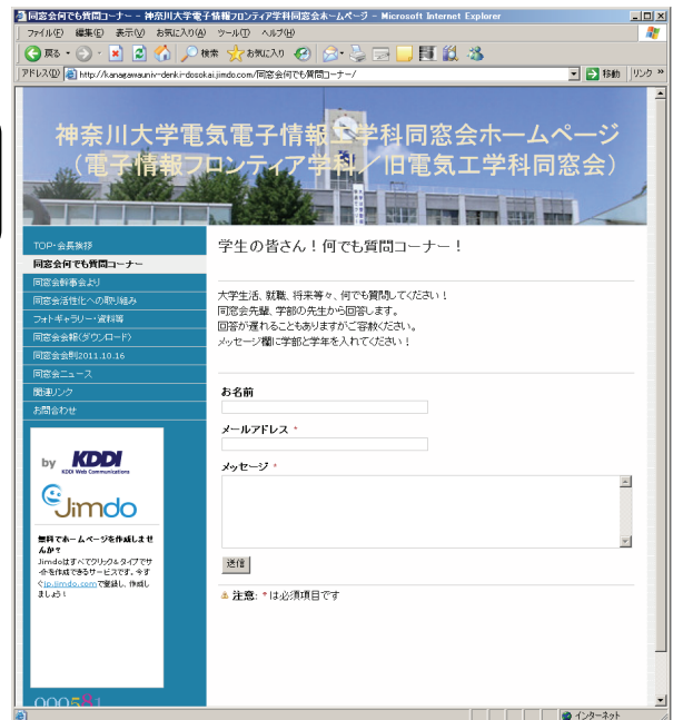
同窓会ホームページ